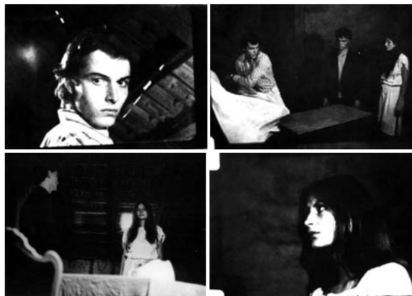
Nalezená vyzvěšovaná políčka z filmu.